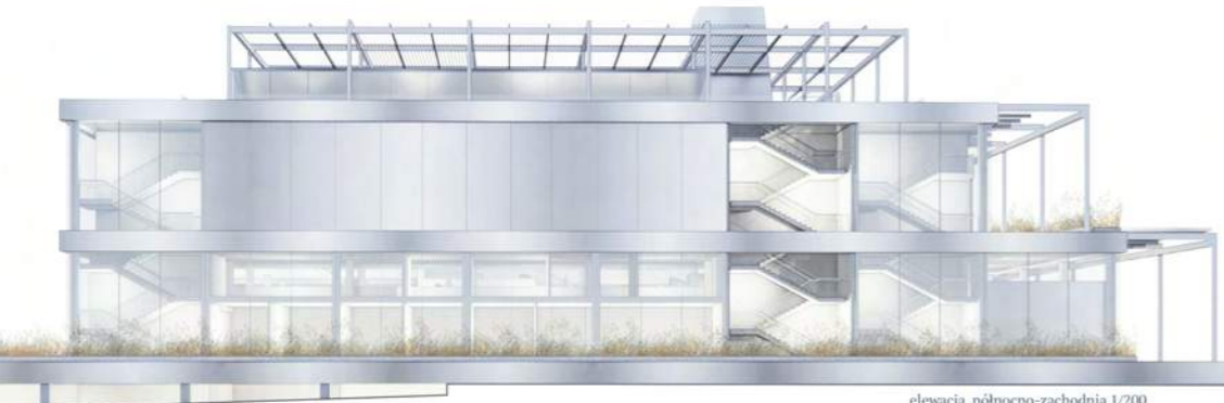
elevacja północno-zachodnia 1/200