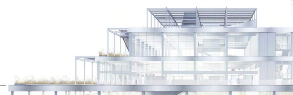
elevacja północno-wschodnia 1/200