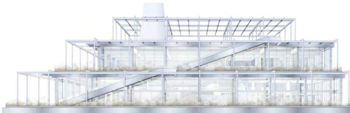
elevacja południowo-wschodnia (od strony ulicy Gdańskiej) 1/200