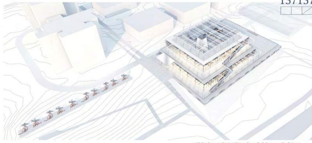
widok z lotu ptaka 1 (z kierunku południowo-zachodniego)