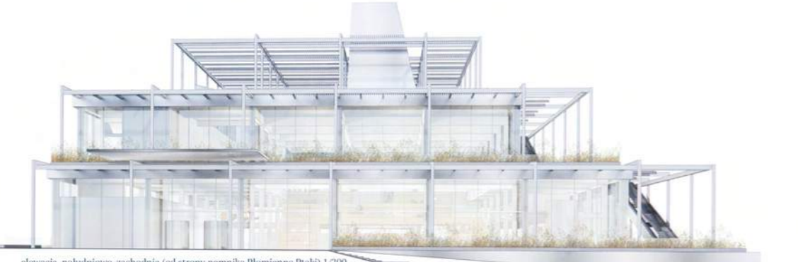
elevacja południowo-zachodnia (od strony pomnika Płomienne Ptaki) 1/200